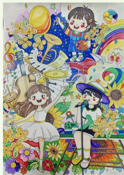
艺术节的女孩 普陀城北小学一(七)班小记者 黄言心(证号 D1008)