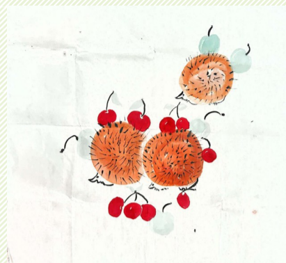
小刺猬 朱家尖小学四(二)班小记者 石佳艳(证号 D07085)