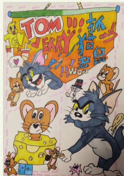
猫和老鼠 岱山实验学校二(二)班小记者 陈骏霖(证号 A0138)