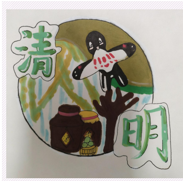
清明 沈家门一小四(4)班 小记者 方紫瑜(证号D030711)