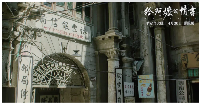
电影《给阿嬷的情书》

历史上，在19世纪末到20世纪中叶，潮汕、闽南一带很多青壮年被逼“下南洋”，从事着重体力劳动。