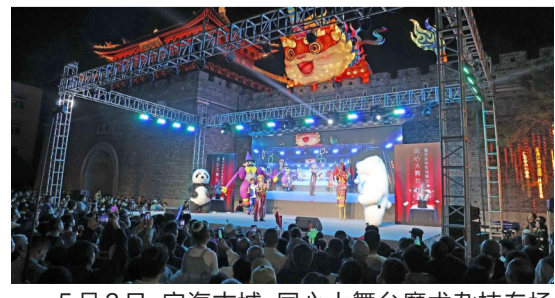
5月2日，定海古城，同心大舞台魔术杂技专场演出，精彩表演吸引市民围观驻足