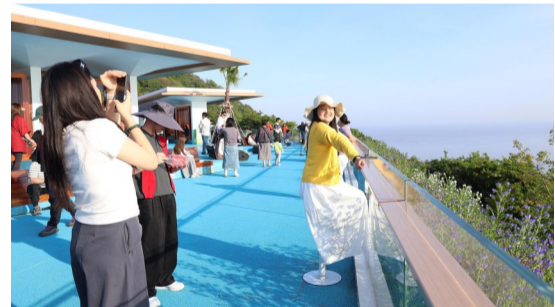
5月1日，朱家尖日落广场风景怡人，驻足游客纷纷拍照观光、定格美景