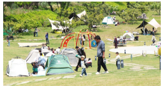
5月2日，众多市民游客来到东海百里文廊白泉段觅林古树园露营休憩，亲近自然，乐享户外美好时光