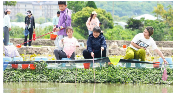
5月4日，不少市民来到普陀田园综合体，体验休闲垂钓龙虾的乐趣