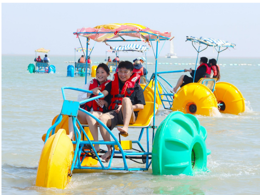
5月1日，游客在朱家尖南沙景区体验水上三轮车休闲项目，尽享假日乐趣