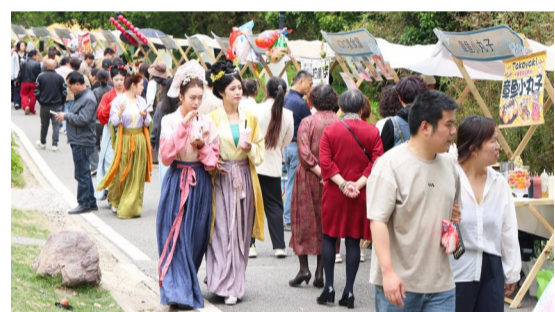
5月2日，普陀区沈院，前来游玩观光的游客络绎不绝

“五一”假期期间，全市各大景区游人如织、人气足，广大市民游客放飞心情，或亲近山海，或感受美丽乡村魅力，或探访古城……大家在愉悦的心情中享受假日时光。