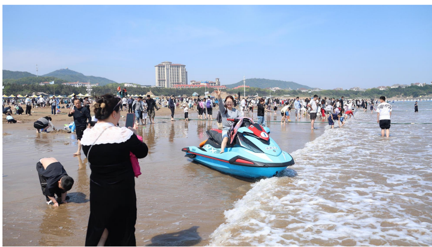
5月1日，朱家尖南沙景区人头攒动，游客亲近碧海金沙，乐享滨海风光