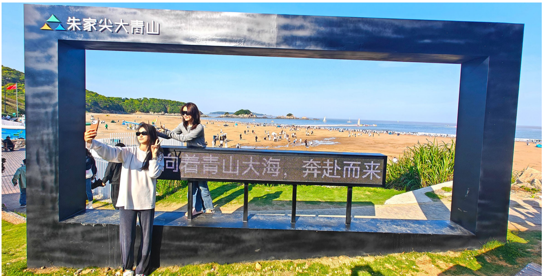
5月1日，游客在朱家尖里沙景区拍照留影