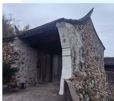
古村小店