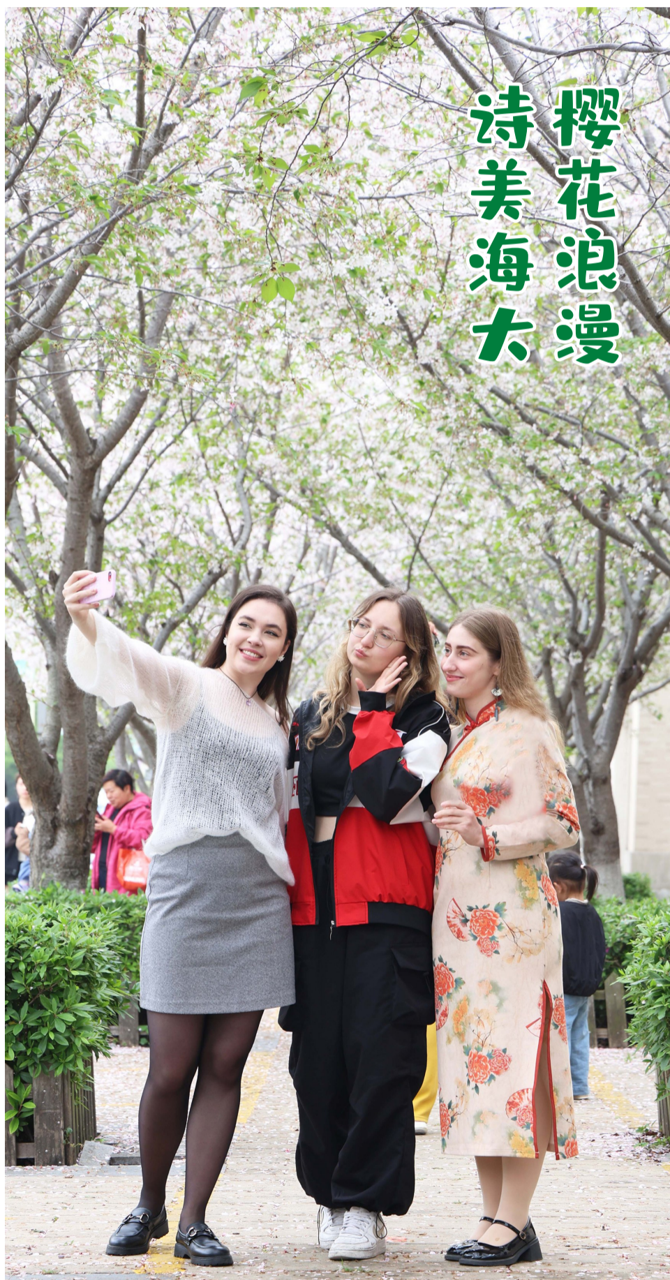
四月的浙江海洋大学樱花盛放，春意盎然。4月15日，学校第十二届海上樱花节如约而至，吸引众多师生与市民前来赏樱打卡，现场人气十足。