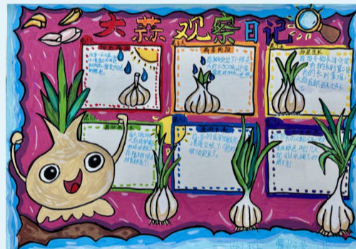
大蒜观察日记 朱家尖小学二(4)班 小记者 费好萱(证号D07043)