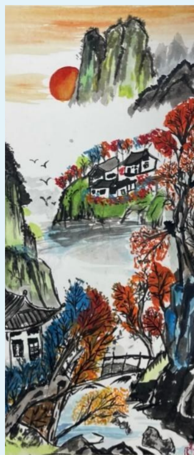
秋江山居图 普陀城北小学三(5)班 小记者 王芊诺(证号D1021)

这次转学,不仅让我收获了珍贵的友谊,更让我明白:陌生的环境并不可怕,只要勇敢地迈出第一步,就能收获意想不到的温暖。(指导教师:余姣姣)