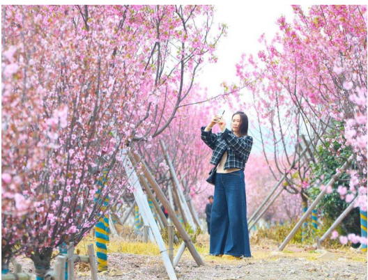
普陀区舵岙公园,市民正在观赏樱花并拍照留影