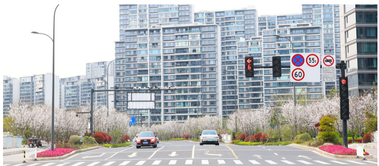
新城体育路,两旁的樱花树花开艳丽,构成一道风景线