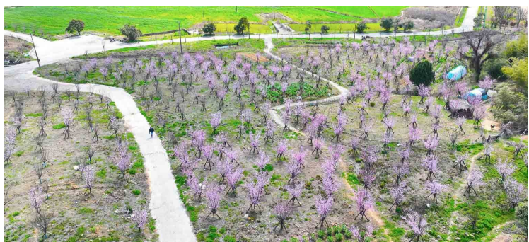
新城千岛街道城隍头社区,1400余棵榆叶梅进入盛花期,勾勒出一幅美丽乡村的美好画卷