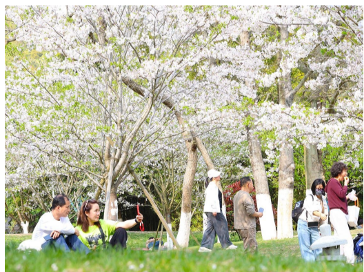
普陀区沈院,樱花盛开,游人如织