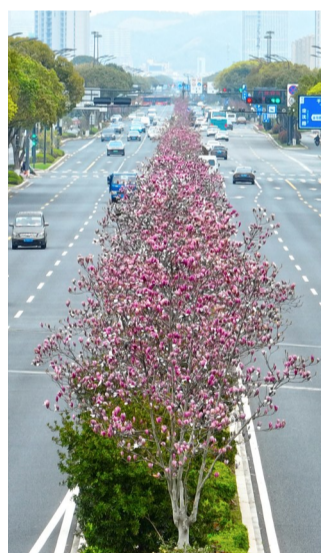
海天大道新城段,二乔玉兰美丽绽放