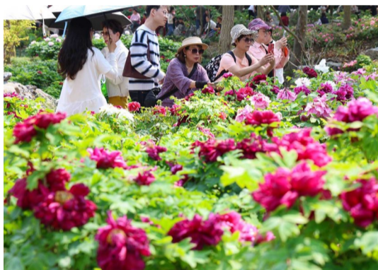
普陀区沈院牡丹园,大片牡丹花竞相绽放,吸引不少市民前来打卡拍照