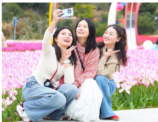
朱家尖大青山景区四季花海,5.5万株郁金香盛放,吸引众多游客前来欣赏、拍照留影