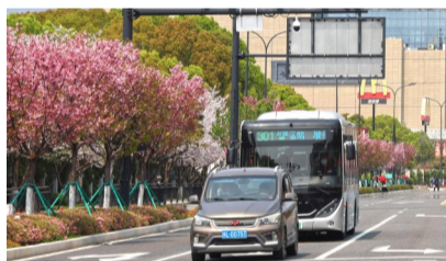
普陀区东港海印路,盛开的樱花扮靓车行线