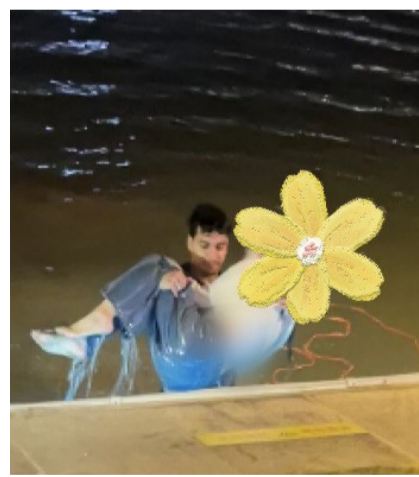
金沙湖救人的小伙子，找到了！

4月6日晚9时许，杭州钱塘区金沙湖北岸。有女子落水，一名正在湖边的黑衣男子，扔下手机便纵身跃入湖中，将女子托举上岸。