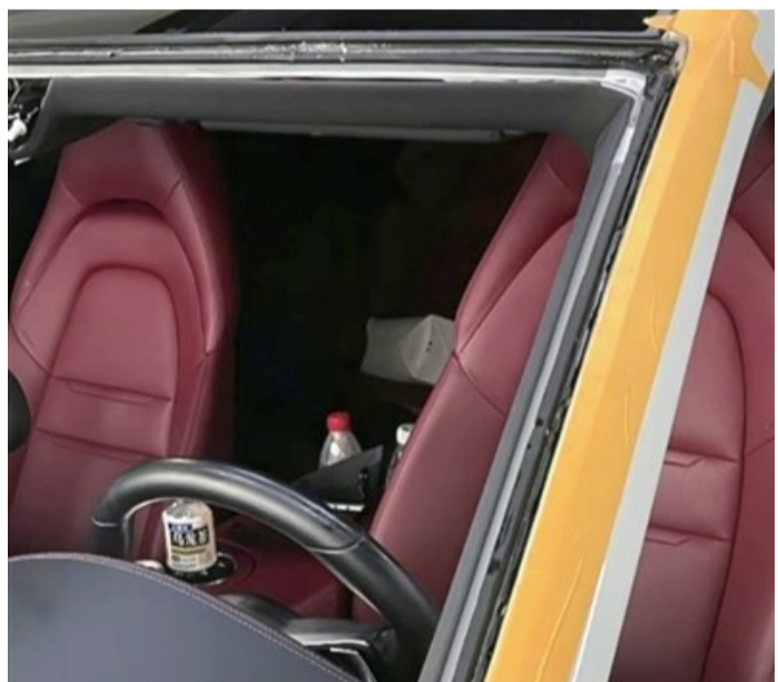
砸碎的保时捷玻璃

“我的这款AED翻盖就开机,全程都有语音提示,按语音提示操作即可,有儿童和成人两种模式,电极片粘贴的位置都有图标标志,操作要点都有详细语音提示。还有一点,不会