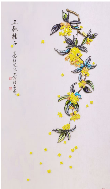
金奖作品《桂意秋日》

在传统工艺基础上加入了铜丝,让盘扣可以随心所欲地拗出各种形状,同时又保留了纯手工的温度。图案空隙则用包裹了布的铜丝填充,让盘扣由线成面,更为饱满,也有了更多造型的可能。