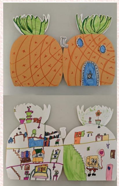
岱山实验学校一(5)班 小记者 宋亦源(证号A0121)