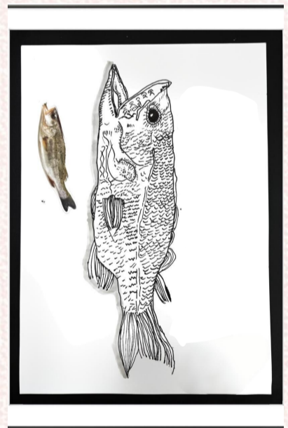
沈家门小学二(2)班 小记者 刘培然(证号D04004)

这次杭州湾国家湿地公园之行,我不仅饱览了秀丽的自然风光,还与可爱的小动物们亲密互动,更学到了不少关于鸟类和环境保护的知识。这里实在是个令人流连忘返的好地方,我下次一定还要再来!