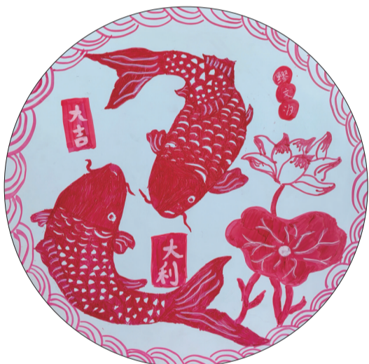
普陀城北小学二(4)班 小记者 缪文汐(证号D1014)

这就是我的家乡登步岛。这里虽然没有学校、没有商场,也没有游乐园,村子里居住着一群老人。可我很喜欢这里,因为在这儿我能像一匹脱缰的野马自由自在地奔跑、玩闹,到处都是快乐的气息。