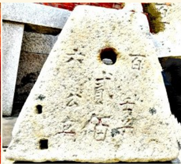
百崎郭氏“元兴”号在沈家门经营水产用的公砣和秤砣