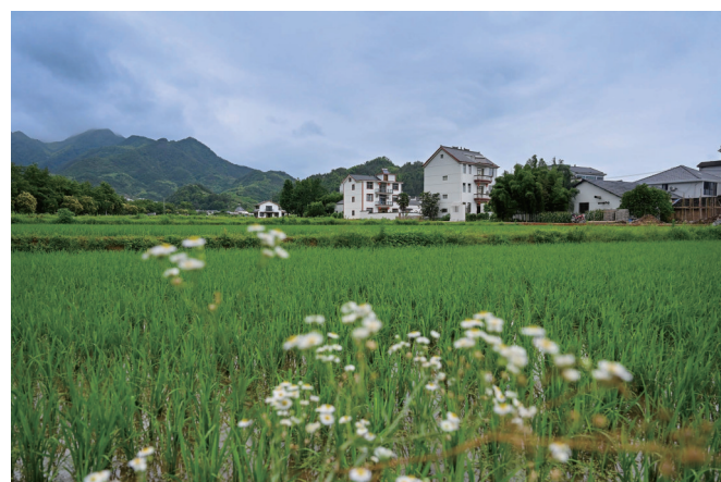
稻田花语,衢韵乡居