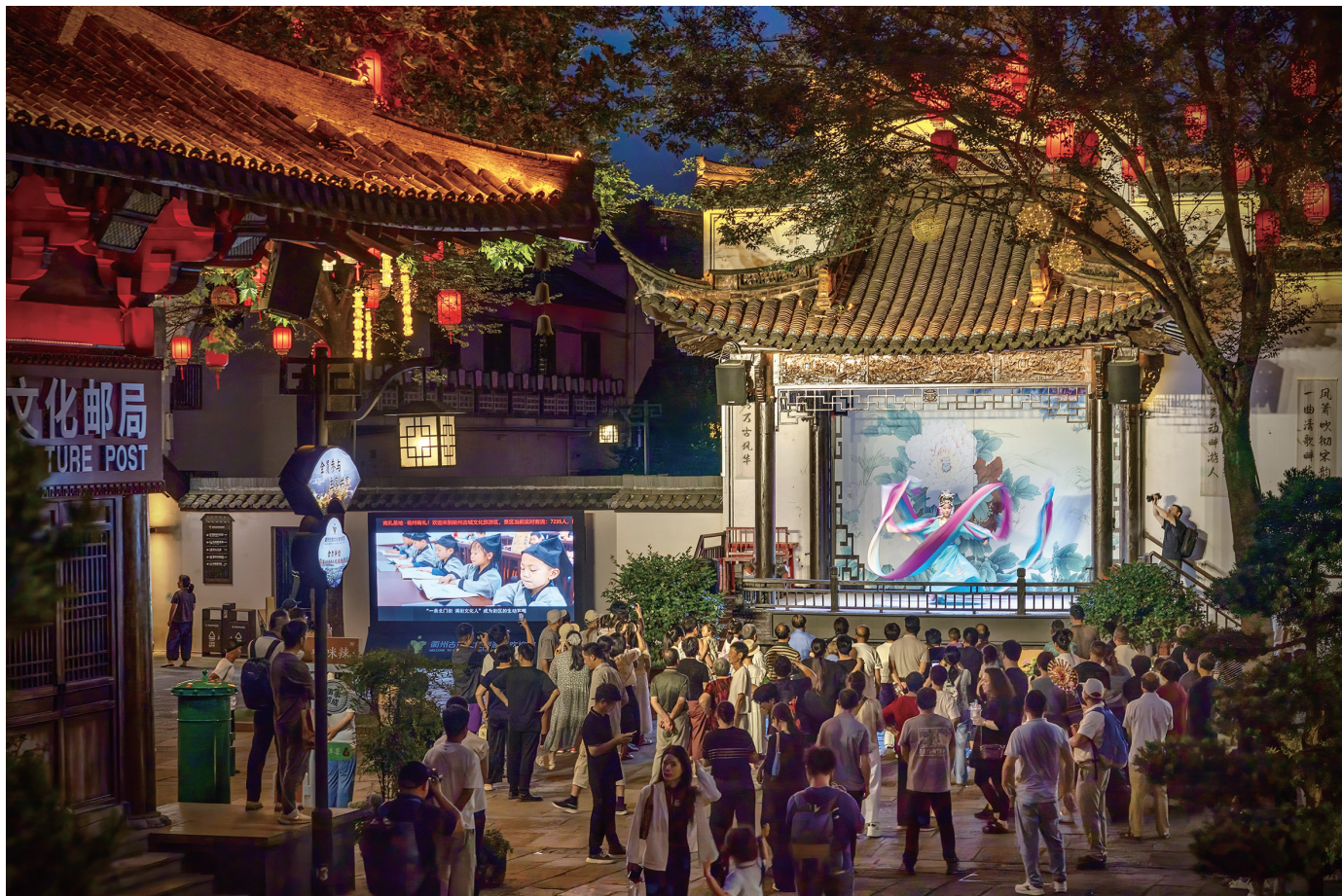
一座古城的时空折叠