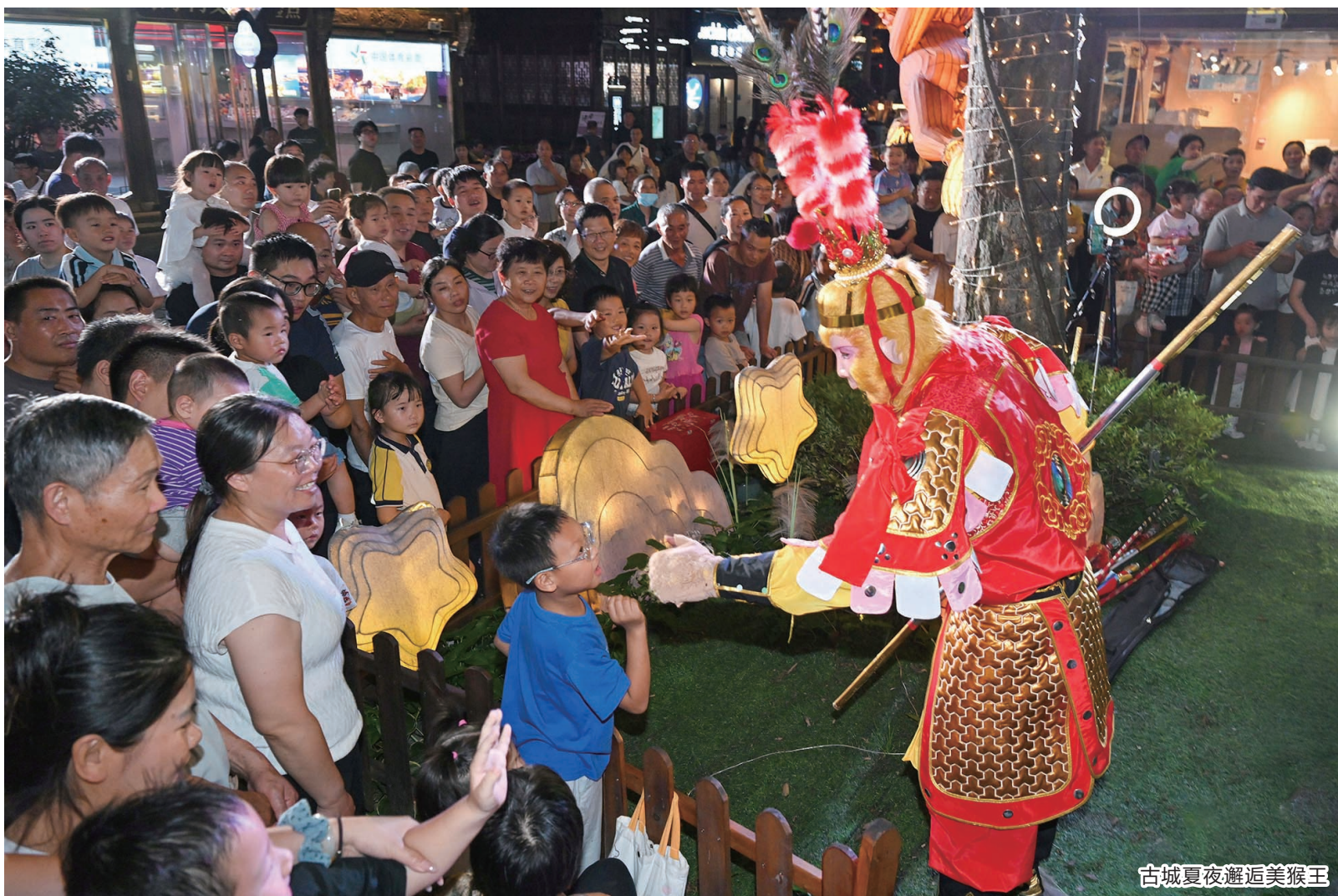
古城夏夜邂逅美猴王