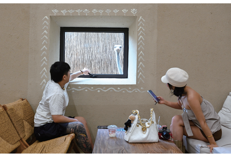
在栖息岭·SAVANNA非洲主题(衢州店),鸵鸟窗外探头成意外风景