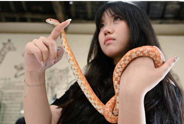
在栖息岭·SAVANNA非洲主题(衢州店),一女孩与宠物蛇互动的瞬间