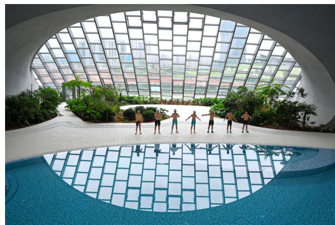
衢州体育中心游泳馆,光与水的梦幻剧场