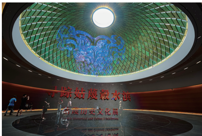
姑蔑博物馆