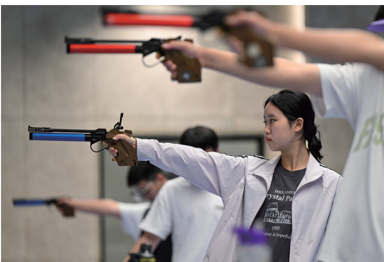
衢州灵鹫山射击中心,举枪凝神