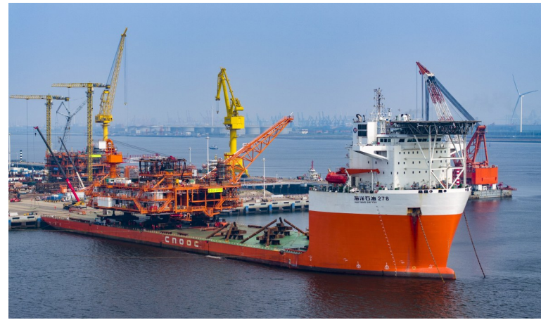
这是6月16日拍摄的渤中26-6油田开发项目(二期)平台完工装船现场(无人机照片)。

6月16日,随着最后一座平台在天津市滨海新区成功装船,全球最大变质岩油田——渤中26-6油田开发项目(二期)全部平台陆地建造完工,为油田按期投产奠定基础。