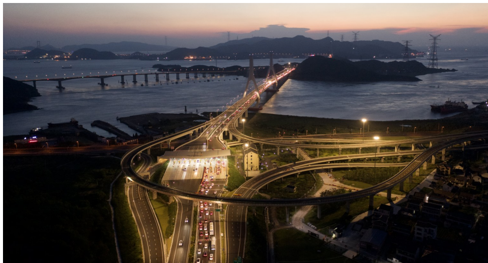
舟山连岛高速公路

开庆《四明续志》卷一记载，南宋庆元府（其境域相当于今宁波市和舟山市）曾将昌国县的石衢山、秀山等砂岸收入划拨庆元府学作为养士收入，其中石衢山砂岸年纳26786贯，秀山砂岸年纳2500贯。开庆《四明续志》卷四也记载了南宋宝祐五年（1257）将昌国县14个买扑酒坊的部分收入划作庆元府学养士收入及水军将佐供给钱的故事。其中，收入最多的