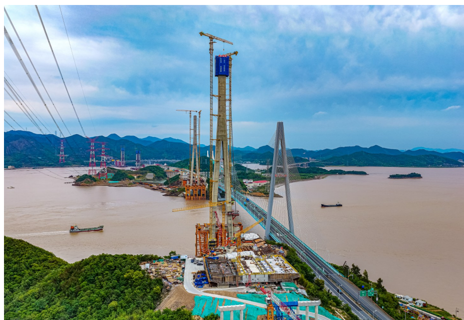
建设中的甬舟铁路桃夭门公铁两用大桥