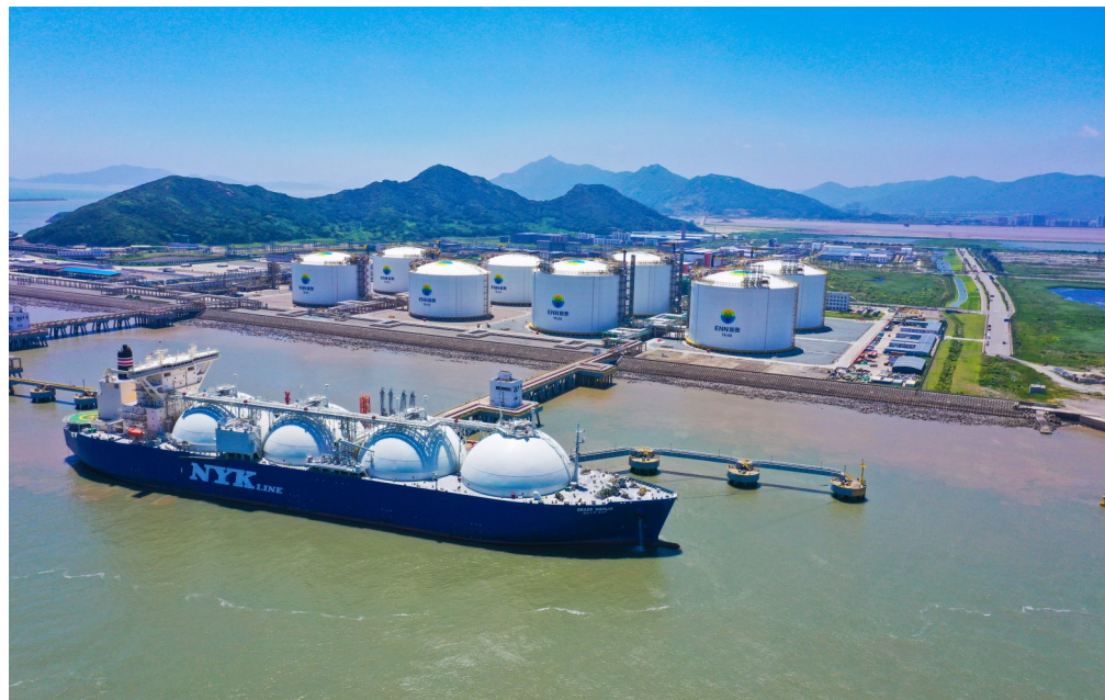
新奥舟山LNG接收站