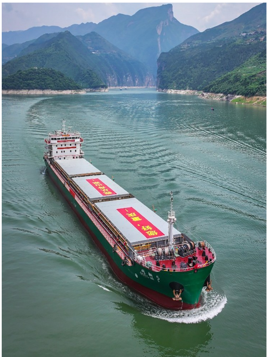
江海直达“创新5号”轮完成首航

九年探索实践，在舟山展开一幅开放发展的壮阔图景。“十五五”开局之年，舟山将以更高站位乘势而上，打好系列国家战略落地攻坚战，在服务国家战略中加快实现舟山高质量发展。