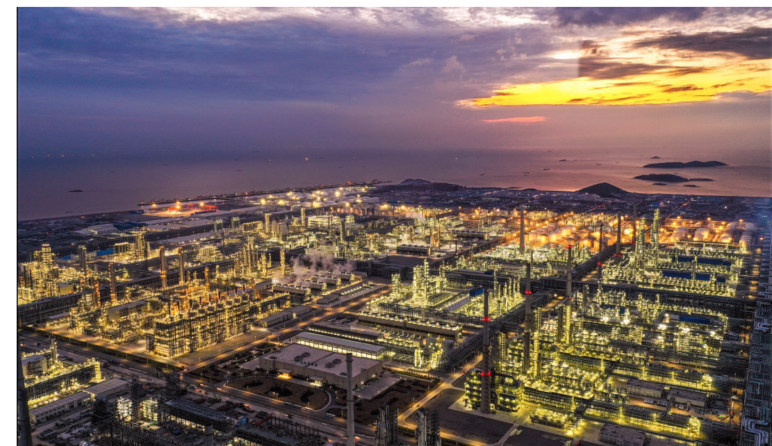
舟山绿色石化基地