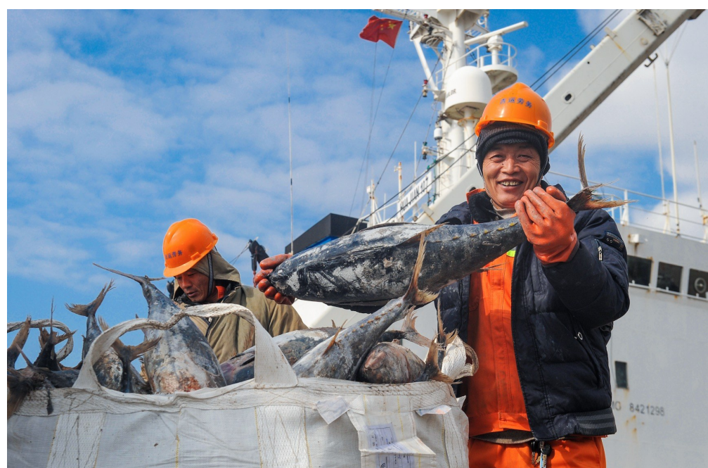
国家远洋渔业基地