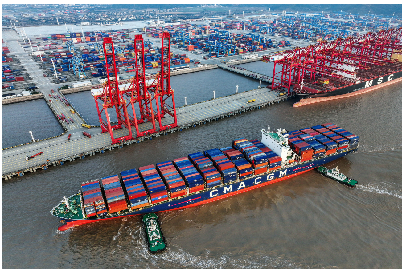
宁波舟山港金塘港区