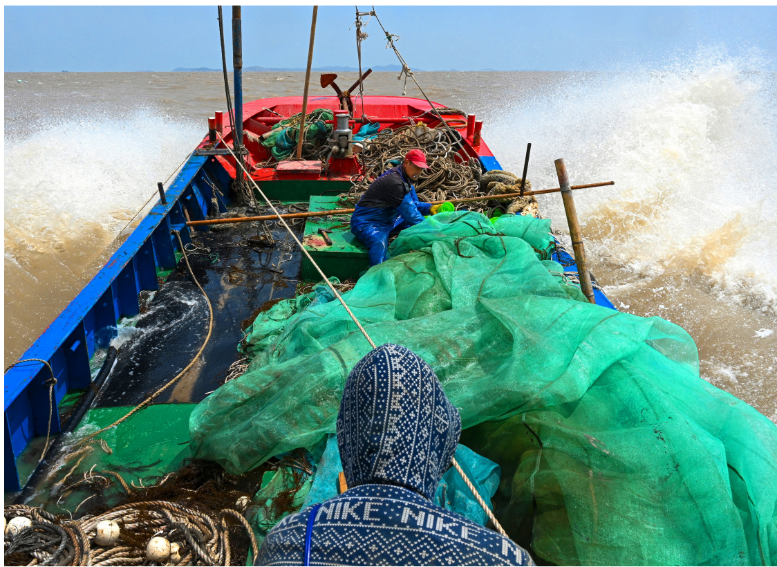
海面波涛汹涌,渔船在大海里颠簸前行

嵛泗县洋山镇是舟山张鳗苗主要乡镇之一,约400名渔民从事该作业。今年亏损是眼前的现实,但他们用粗糙的双手与大海博弈,坚守着向海而生的生存法则。