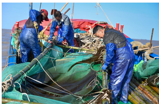
船老大华平也来到甲板,共同整理网具