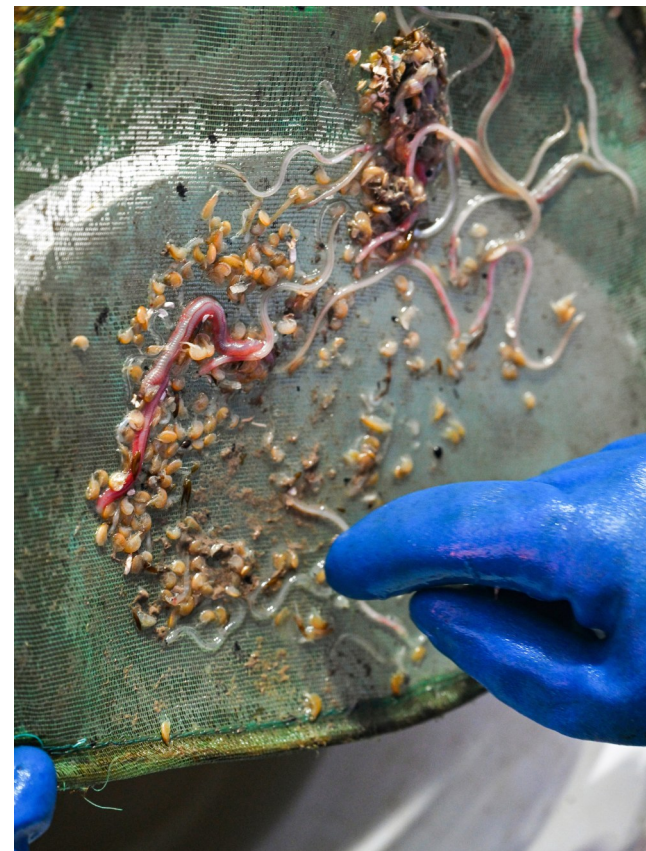
几条透明纤细的鳗苗混杂在渔获物中,渔民在仔细筛选