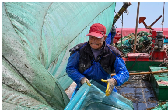
船员正用力整理鳗苗捕捞网具