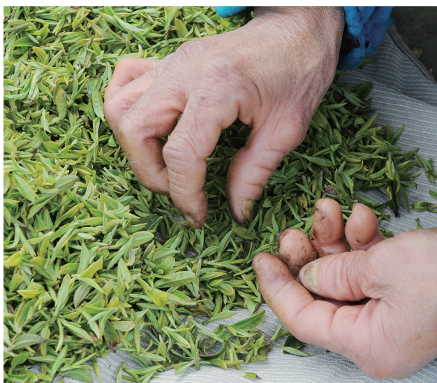
一双老手,一袋新绿