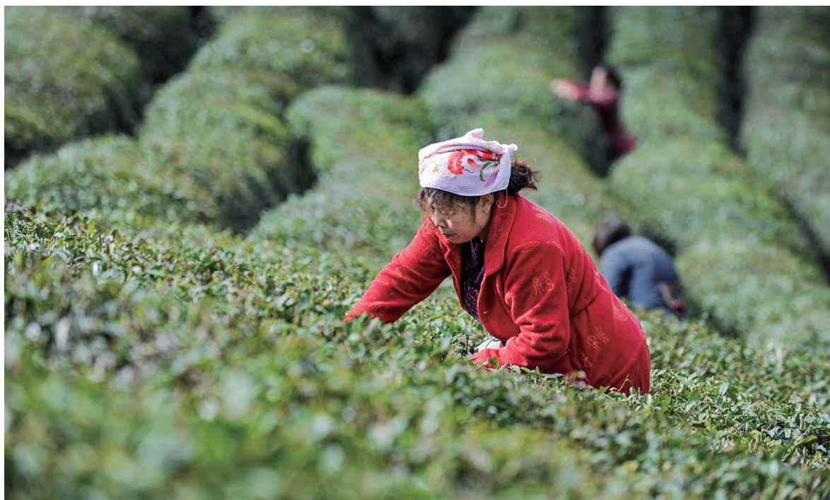
采茶女俯身于新绿间,一抹红衣点亮了整片茶园