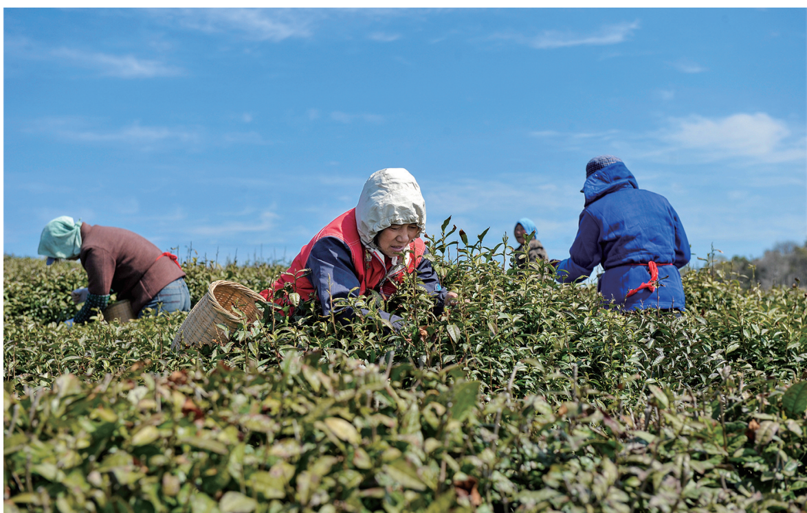
在蓝天与新绿间,采茶女们辛勤劳作,织就一幅海岛春茶丰收图