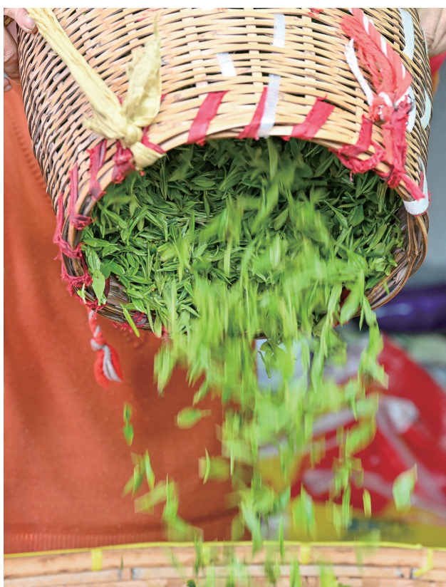
竹篓轻倾,新绿倾泻而下,是春日茶园鲜活的场景之一