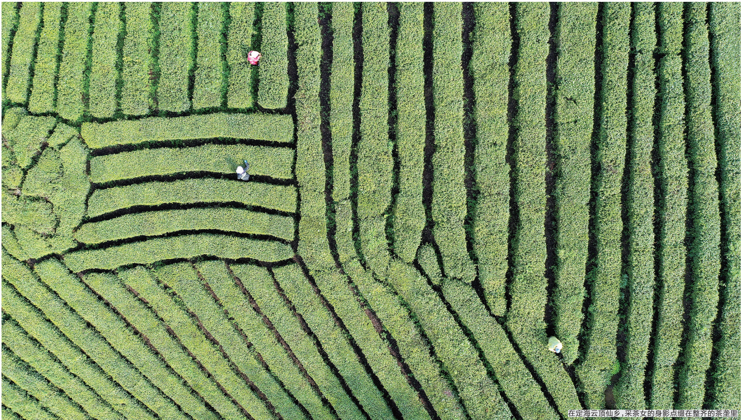
在定海云顶仙乡,采茶女的身影点缀在整齐的茶垄里