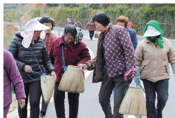
上午的采摘结束,采茶女们笑着打趣:“你今天摘得可比我多!”