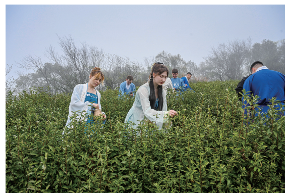
在岱山磨心山茶园,外国友人化身“采茶人”,用指尖采摘嫩芽,触摸中国茶文化的底蕴