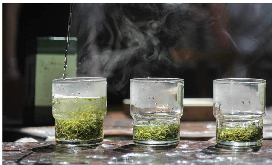
泡一杯刚做的春茶,品春日鲜香