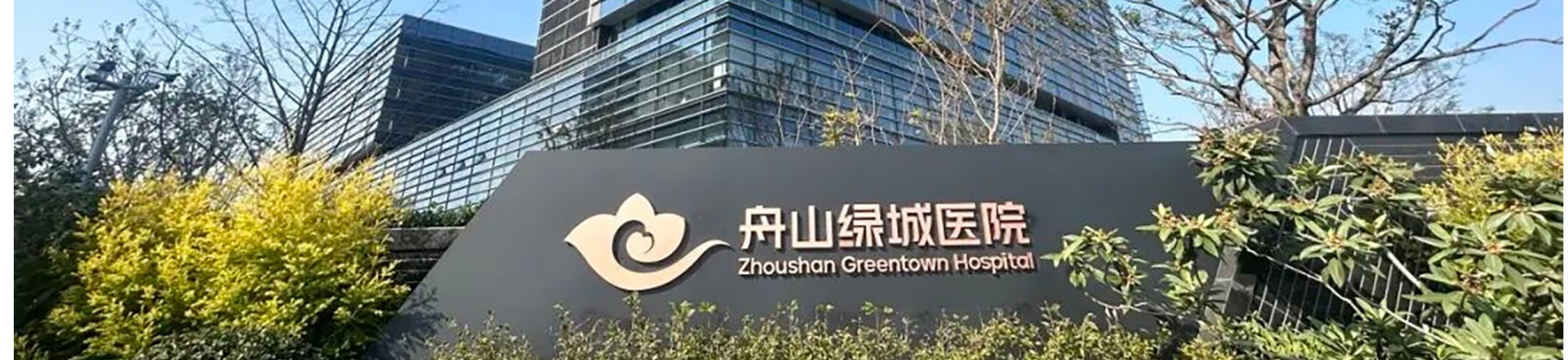
舟山绿城医院 Zhoushan Greentown Hospital