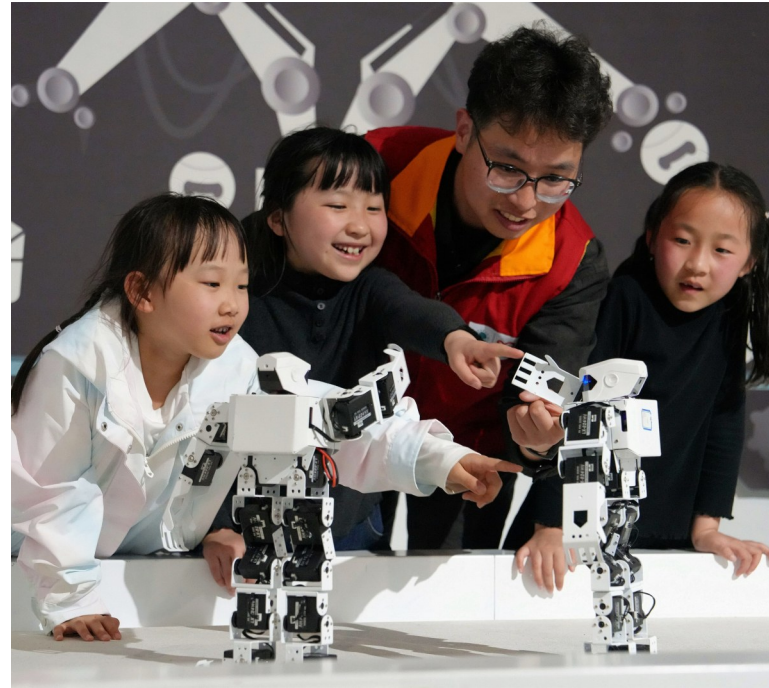
4月2日,志愿者带托管班孩子在江苏省海安市科技馆观看机器人表演。 4月初,春假与清明小长假“牵手”,各地中小学生学习参加丰富多彩的活动,享受欢乐时光。