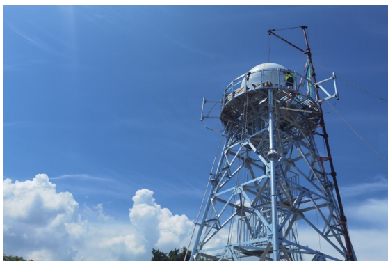
定海X波段相控阵天气雷达