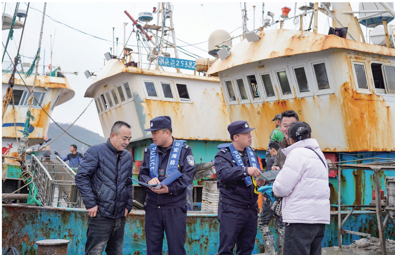
图为普陀区公安分局组织民警深入辖区渔港码头，保障复工复产有序推进

春节过后，千帆竞发，机器轰鸣。我市这个海洋经济大市迅速转入复工复产节奏。面对节后人员流动大、生产任务重、安全压力持续增大的复杂形势，我市公安立足职能、主动作为，以“平安定制”服务为抓手，融合传统勤务与科技赋能，织密立体化防控网络，为全市节后复工复产保驾护航。