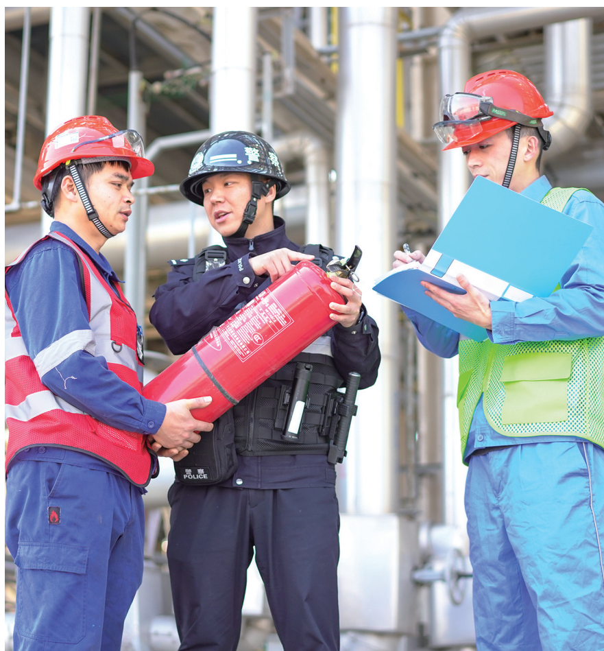
图为岱山鱼山派出所民警同企业安防人员对企业各类安防设施开展隐患排查

去年11月初，秀山乡一企业内发生一起内部商业资料泄露案件。企业安保人员通过“警企+”平台的一键报警功能，迅速将现场情况反馈至派出所综合指挥室。指挥室立即启动应急响应机制，通过平台精准定位事发位置，并调度就近的应急梯队和专职民