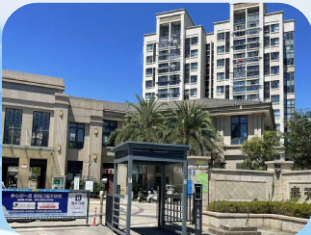
春天里 (新城-住宅) 舟山星城润悦物业服务有限公司

和平花苑小区联合物业公司进社区指导下,秉持“党建引领、和合共治”理念,通过加入环南街道“物业+”组织,有效化解治理难题。小区健全多方联动机制,规范业委会决策,优化物业精细化服务,并推动执法与专项服务常态化入园,以高参与、高效率、高保障营造出环境优美、邻里和睦的宜居环境。未来,小区将持续以“和”凝聚温情,以“合”共创社区价值,让每一次服务,都成为美好生活的注解;让每一次互动,都化为彼此信任的基石。