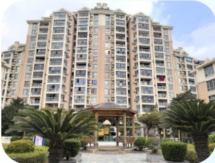
钻石苑 (嵊泗县-住宅) 浙江颐景园物业服务有限公司嵊泗分公司

浙能蓝庭小区在东港街道统筹指导下,以党建为核心纽带,深化社区党组织、业主委员会、物业服务企业“三方协同”治理机制,逐步构建起“共建共治共享”的小区建设共同体,先后荣获“省级园林居住区”、“红色物业”示范小区、“美好家园”、优秀物业小区等荣誉称号,持续推动小区管理从“有序”向“优质”、居民生活从“安居”向“乐居”升级。