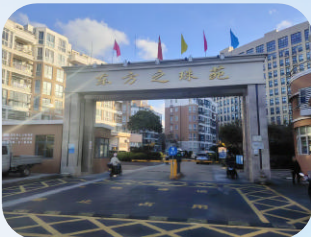
东方之珠苑 (嵊泗县-住宅) 浙江紫荆花物业服务有限公司嵊泗分公司

颐景华府在日常物业管理中以“和”为基,致力于“和谐”“和睦”的小区人文环境建设,着力营造业主与物业之间、业主与业主之间的和谐关系,推动物业角色从矛盾纠纷的“调解者”向和谐小区的“营造者”转变。同时以“合”为链,注重内外部资源整合,借助政府、社区、业主及第三方资源,构建多方联动、协同共治的小区生态环境。通过强化党建引领,将基层治理与日常服务相结合,搭建信任互惠平台,积极打造有事先商量,有事能商量,有事好商量的良好治理环境。