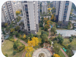
颐景华府 (新城-住宅) 浙江颐景园物业服务有限公司舟山分公司

物业服务坚持标准化与定制化结合,在做好基础保障的同时,延伸服务链条,实现“办公保障”与“产业赋能”双重价值。