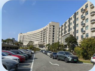
岱山县行政中心 (岱山县-非住宅) 浙江亚太酒店物业服务有限公司

海上明月府小区以党建为引领,构建“党建+物业”机制,建立社区、业委会、物业的三方联动机制,定期召开三防联席会议,高效响应业主诉求、调和邻里的细微分歧。通过整合社区资源打造共享文化空间、联动政府部门开展专项行动、改造园区通行设施、落地便民服务,多次组织业主开展捐物义卖支援远方受灾地区等公益活动,传递邻里温暖。项目已获评省级“红色物业”小区、优秀物业小区等荣誉称号。未来将持续深化党建引领与三方协同,以精细化服务和高效治理,守护美好生活,让“和合”之花在园区持续绽放。