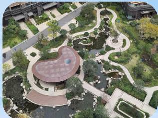
和平花苑 (定海-住宅) 舟山星城润悦物业服务有限公司

宁兴·金色海岸花园以党建为引领,构建社区、业委会、物业三方联动治理网络,打造党建引领的小区治理共同体,践行“大事共议、实事共办、难事共商”机制,营造优质宜居环境。小区扎实做好日常服务,在节假日增设多元社区生活服务,每月定期开展“爱系于发,情系于剪”老年义剪活动,助推小区精神文明建设,增强居民归属感与和谐幸福。