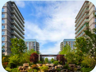
浙能蓝庭 (普陀区-住宅) 绿城物业服务集团有限公司舟山分公司

这些项目在党建引领下,深入践行“和合”理念,通过整合资源、优化服务、凝聚共识,不仅显著提升了人居与办公环境,也为全市物业管理服务水平的整体提升提供了可复制、可推广的实践经验。近年来,我市持续推进物业管理创新实践,坚持以党建引领为核心,深化社区、业委会、物业服务企业“三方协同”机制,积极构建“共建共治共享”的基层治理新格局。此次获评的一批管理规范、服务优质、环境宜居、群众满意的住宅小区与公共项目,正是我市“和合物业”建设成果的生动缩影。展望未来,以此次评选为契机,典范的带动效应将持续释放,“和合”之花必将在千岛之城更加绚烂地绽放。