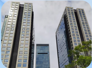
新城商会大厦 (新城-非住宅) 舟山市锦盛物业管理有限公司

伊顿华府小区以党建为引领组建红色物业联盟,全面构建以物业管理服务、党员先锋引领、多元力量参与、社团文化滋养的协同治理体系。同时结合住户多元化的特点,小区孵化出了“舟大嫂”“润舟铁甲退伍军人志愿服务队”“萤火映舟”青少年志愿服务队等群团组织。通过多项举措有效引导业主关注、参与、融入社区生活,共同营造同心同德、共建共享的和合家园。