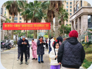
宁兴·金色海岸花园 (普陀区-住宅) 舟山市普陀区众安物业有限责任公司

物业企业连续6年信用等级评定结果为AAA,获得“舟山市物业管理示范大厦”等荣誉称号,推行ISO9001质量管理体系,制度公开透明,建立及时反馈与应急预案机制,在消防、电梯、非机动车管理等环节落实专人专管,持续开展安全自查,以规范、专业的服务营造安全有序的办公环境。