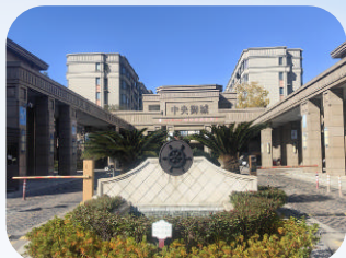
中央御城 (新城-住宅) 舟山邦泰物业管理有限公司

春天里小区积极响应各级政府部门倡导的红色物业创建活动,先后被评为“省级红色物业”“美好物业项目”等荣誉。小区年度物业费收缴率达到98%,得到业主的普遍认可。