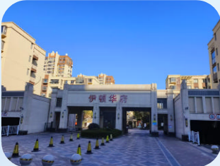
伊顿华府 (新城-住宅) 舟山邦泰物业管理有限公司

岱山县行政中心依托多年行政类项目运营经验,实行24小时值班制,精准对接政务需求,为入驻单位提供标准化、针对性的保洁、安保、工程维修等优质服务。项目凭借规模化布局带来的资源高效调配优势,结合规范成熟的管理模式及绿色低碳举措,为行政中心高效运转提供坚实保障,已荣获“省示范大厦”“市物业服务示范项目”等多项荣誉,赢得入驻单位的广泛认可。