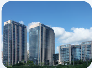
中国(舟山)大宗商品交易中心 (新城-非住宅) 舟山兴港城市服务有限公司

钻石苑小区坚持党建引领,成立兼合式党组织,业委会党员比例达85%,运作规范透明,曾获评省级“红色物业”。物业管理高效规范,建立快速投诉处理机制,率先实行车辆停放收费,常态化养护公共设施与环境,荣获“浙江省节水标杆小区”“市级美好家园”等称号。住建、城管、交警等部门定期联动开展执法服务进小区,信息公开透明,共同营造和谐宜居的社区环境。