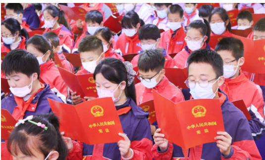
12月4日是第12个国家宪法日。昨天,普陀六横中心小学教育集团皎头校区举行“青春·融守护”国家宪法日主题活动,以各种形式教育引导学