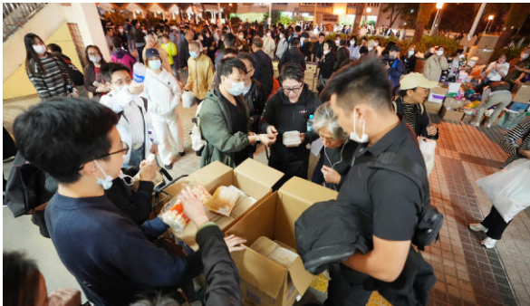
11月27日,义工在宏福苑附近向受火灾影响的市民派发物资