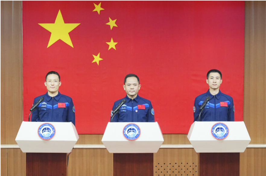
10月30日,神舟二十一号载人飞行任务航天员张陆(中)、武飞(右)、张洪章在酒泉卫星发射中心问天阁与媒体记者集体见面

张静波表示,按计划,神舟二十一号载人飞船入轨后,将采用自主快速交会对接模式,约3.5小时后对接于天和核心舱前向端口,形成三船三舱组合体。在轨