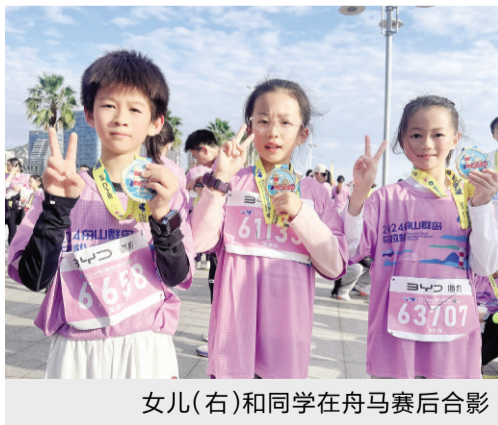
女儿(右)和同学在舟马赛后合影

是啊,养育孩子的过程就是这样,从刚开始的形影不离,到后来的逐渐放手,最后越走越远,完全独立。人生是一场漫长的马拉松赛,我知道接下来面临分别的时刻还有很多,她会离开我们去外地求学;她会组建新的家庭,承担起家庭的责任;她会成为一个社会人,为维持社会稳定贡献自己的微小力量……孩子站在父母的肩膀上看世界,她看到更远的世界,向往更大的舞台。作为父母,早早有这样的觉悟也好,我会更珍惜身边这个小女孩,以及和小女孩共同度过的每一个温馨或者放飞狗跳的时刻。