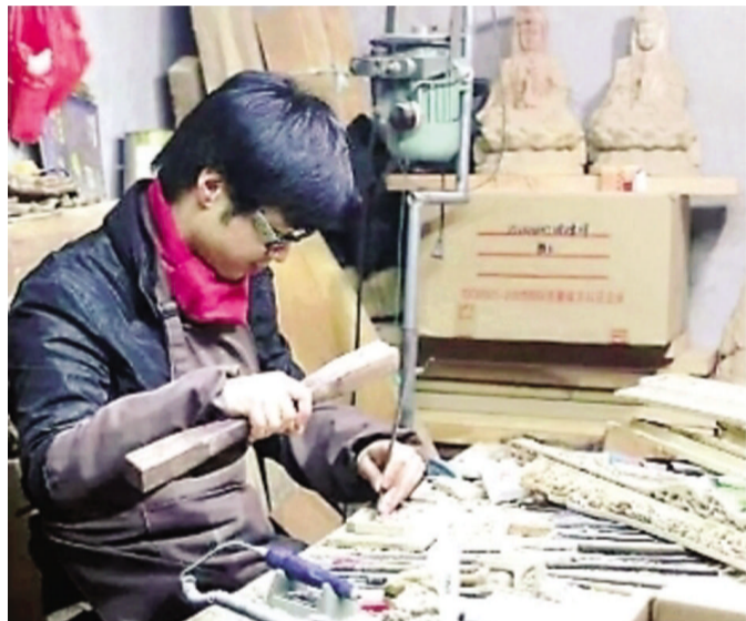
猫木匠沉浸在木工制作中