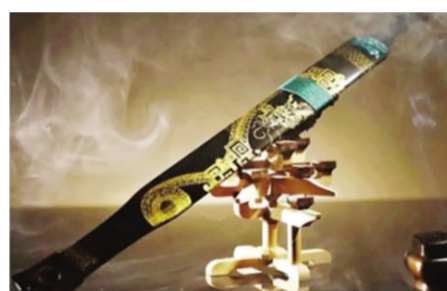
◀猫木匠制作的越王勾践剑剑鞘