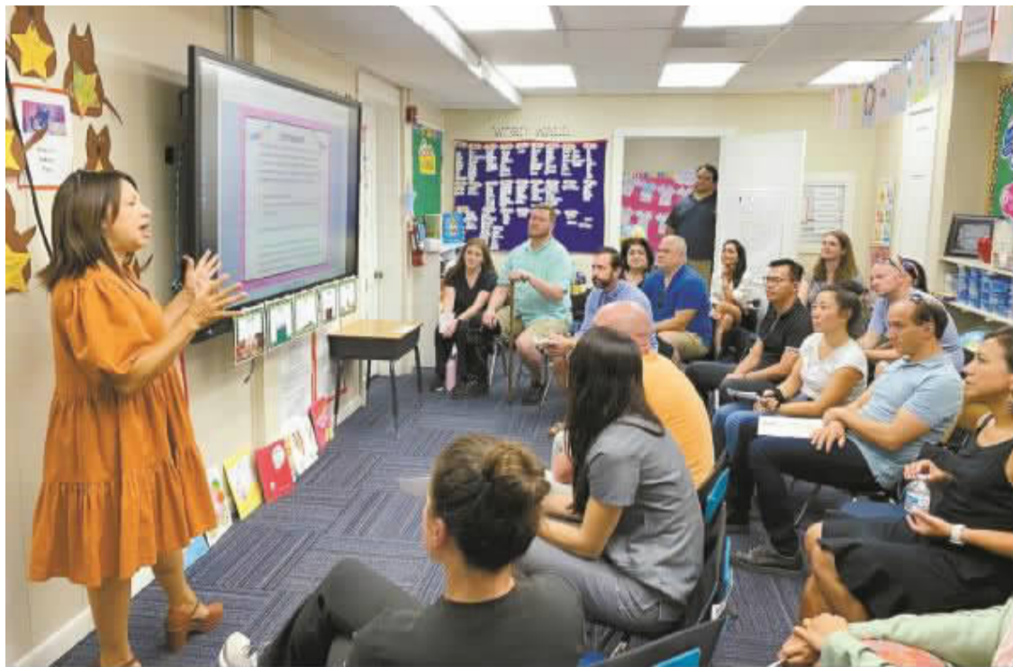
美国德州一家夜校课堂

下班干什么？上课去！白天上班，晚上学艺，夜校正成为各大城市乃至全国年轻人夜生活的新选择，不少热门课程需要“拼手速”才能抢到。在国外，夜校同样受到关注。夜校课程形式多样，内容丰富，包含基础教育、职业拓展，兴趣爱好以及人文学术等，让不同学习者有更多元的选择，并从中得到提升。