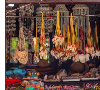
东沙古渔镇街边饰品