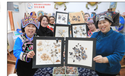
嵊泗县枸杞乡奇观村文化礼堂“知心姐姐”工作室，当地村民和少数民族群众正在一起制作贝壳画

这些非遗还融入了旅游产品之中。嵊泗渔民画、嵊泗海洋剪纸、嵊泗渔绳结等已经华丽转身为可爱的文旅好物。