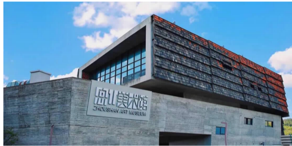
舟山(普陀区)美术馆