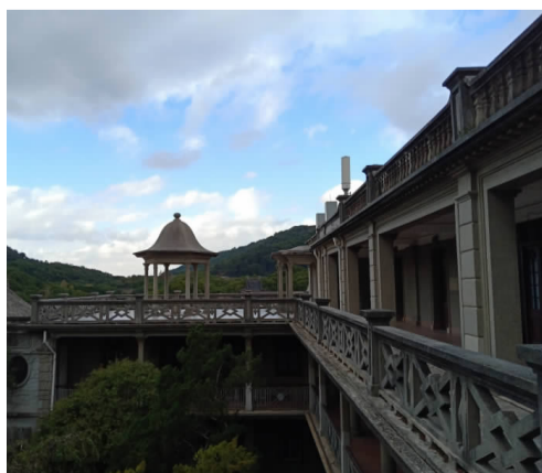
中西合璧的文昌阁

贤云重建，更名为文昌阁。民国九年（1920），当时的住持僧化珣筹资建起水泥楼房及小花园，置假山池桥，改造成中西合璧式建筑。到1960年，僧众遣散，文昌阁改为陆军招待所。