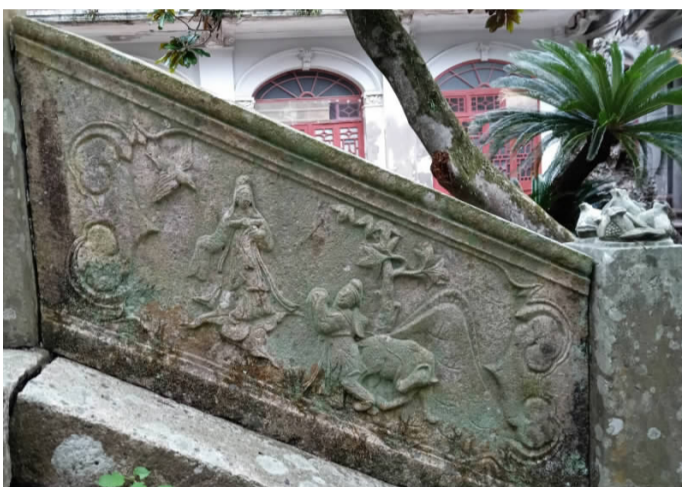
观音菩萨和牧童的图案