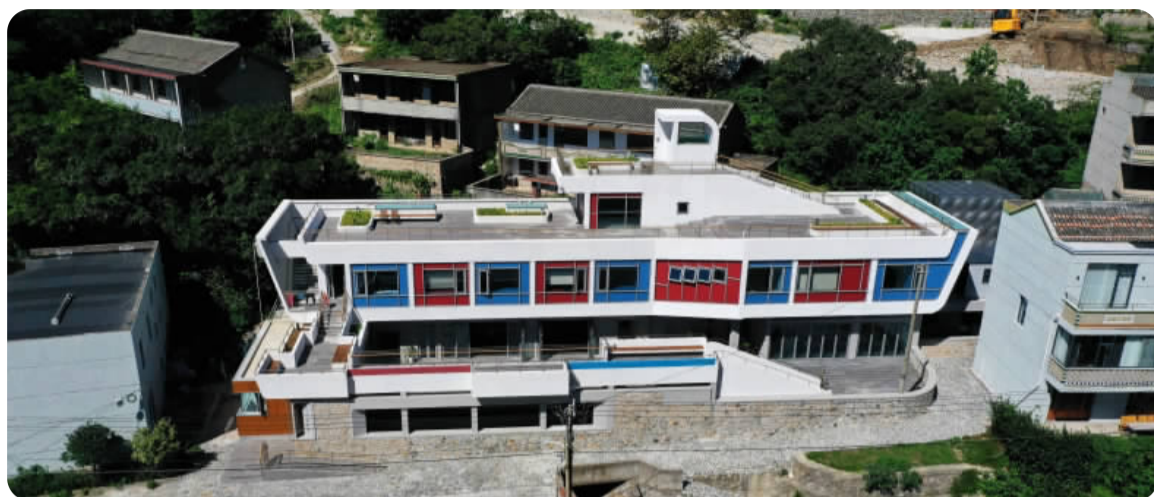
改造后的柴山居家养老照料点