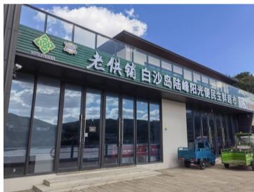
白沙岛陆峰阳光便民生鲜超市