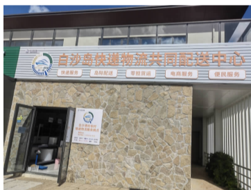
白沙岛快递物流共同配送中心