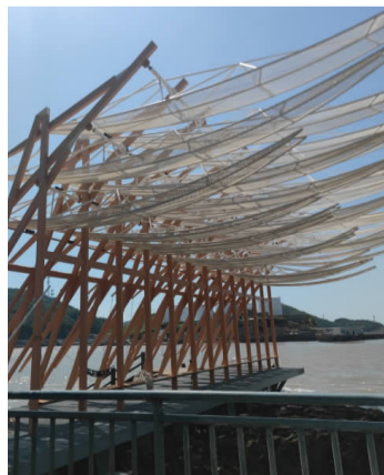
柴山岛码头边的艺术景观