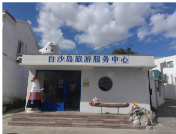
白沙岛旅游服务中心