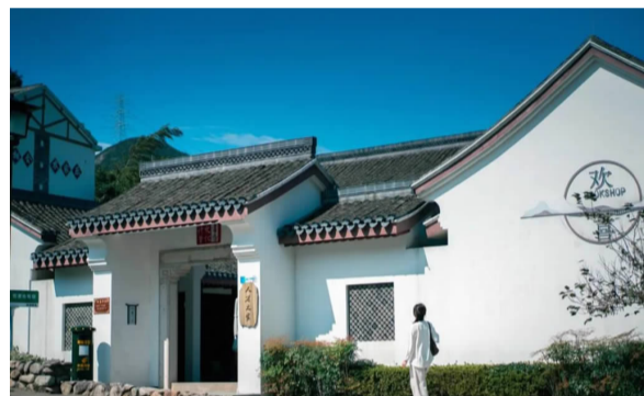
浙江图书馆南洞分馆