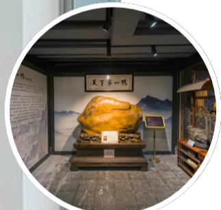
毕家住宅(海洋宝石博物馆)