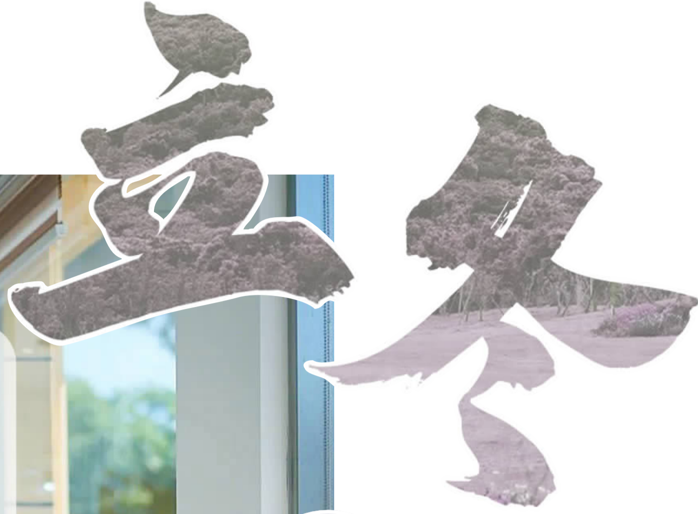
浙江图书馆册子分馆