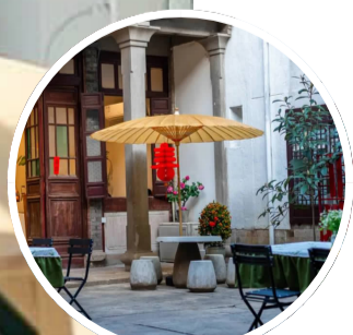
朱家住宅(定海区非遗馆)