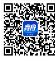
内容来源竞舟新闻微信公众号