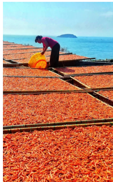
鲜,晒的更是舟山渔民不畏风雨的满载而归,和舟山人的幸福滋味!