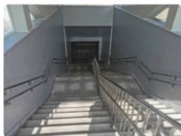
地下停车场出入口(左)行人出入口(右)

普陀区沈家门茶湾地下联络通道日前完成竣工初验，将于11月投入使用，普陀周边学校的学生上下学更安全，东海西路交通压力也能进一步缓解。