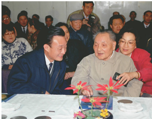
1992年2月10日，邓小平同志在上海与吴邦国同志交谈。

吴邦国同志高度重视人大监督工作，明确提出“围绕中心、突出重点、讲求实效”的监督工作思路，完善监督工作方式方法，有力推动了党中央重大决策部署贯彻落实。任期内，全国人大常委会共听取和审议“一府两院”报告126个，组织执法检查46次，对环保、司法等多个领域开展跟踪监督。他坚持人大监督工作要推动民生问题解决，聚焦“三农”工作、劳动关系、食品安全等强化民生领域监督，着力解决人民群众最关心最直接最现实的利益问题。他坚持把推动工作和完善法律结合起来，本着对党和人民高度负责的精神，在认真研究论证、反复修改完善的基础上推动监督法颁布实施，促进人大监督工作进一步制度化、规范化、法治化。