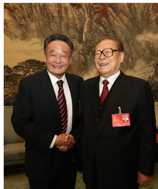
2012年11月14日，中国共产党第十八次全国代表大会闭幕会前，江泽民同志与吴邦国同志在一起。