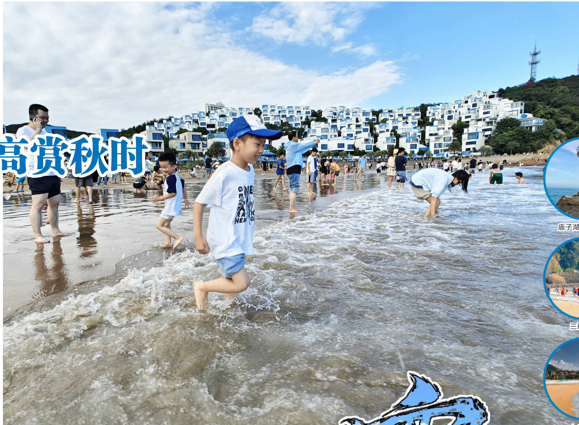
岱山秀山岛爱琴海沙滩，游客戏水欢闹

黄龙岛的元宝山分大小元宝，大元宝石上刻有“东海云龙”四字，小元宝依偎在旁。从元宝石鸟瞰黄龙岛，自有一番海岛美景，而据传，登元宝山摸一摸元宝石，会带来好运，所以游客总是络绎不绝。