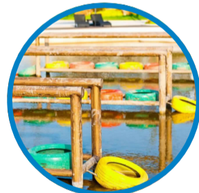
秀山岛滑泥主题公园