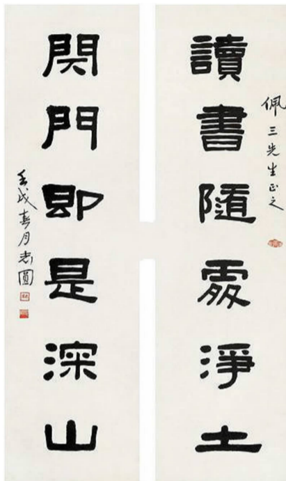
志圆作六言隶书对联

太虚于民国三年到普陀闭关潜修，在未到普陀以前，他先和师兄志圆和尚通信，请他帮忙觅地方闭关自修。志圆和尚替他找好关房后去信请他来闭关，太虚到山上先去锡麟堂去见他受戒时的引礼师，后在锡麟堂闭关三年。