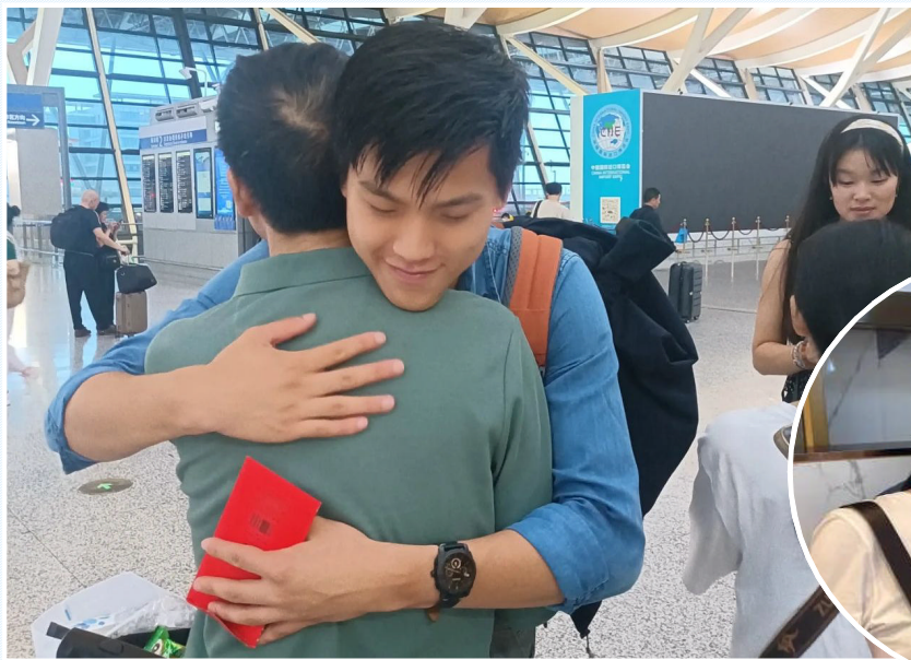
沈达和爸爸妈妈相认