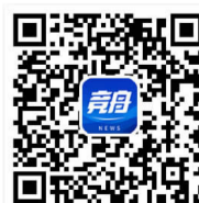
(内容来源竞舟新闻微信公众号)

依据《风景名胜区条例》相关规定，近日，舟山市生态环境局责令该公司限期改正，并处罚款27.8万元。