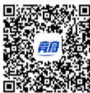
(内容来源竞舟客户端)

填写出发时间、乘车人数，点击确认，确认约车后，等待司机接单。司机接单成功，前往上车点候车。