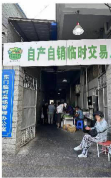
自产自销临时交易点的空间大了许多,层高也高了不少,菜场四边还有一排排窗户,屋顶同样隔着两三个摊位就有一个吊扇,不停地转动着。

“临时交易点”明显感觉比“自产自销”处宽敞通透了不少,透着些许凉意。记者观察到,两处场地都在屋顶处装着吊扇,但由于“临时交易点”层高较高,四边还有窗户,南北通透,有些摊主还在摊位前通过洒水等方式降温……整体比起隔壁“自产自销临时交易点”凉爽一些。