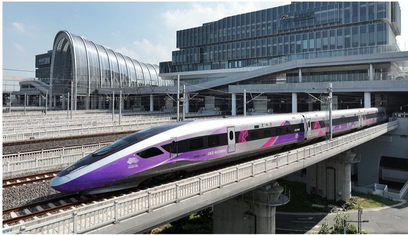
杭温高铁首发列车G9505次，从杭州西站开出

9月6日9时许，身披虹韵紫色的复兴号杭州亚运列车缓缓驶离杭州火车西站向温州进发，至此浙江百姓期盼已久的杭温高铁开通。