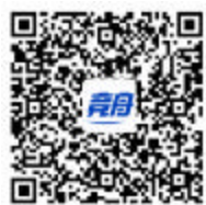
(内容来源竞舟客户端)

五峙山省级重要湿地生态修复项目实施以来,湿地保护成效显著,让珍稀水鸟得以在此休养生息,其中中华凤头燕鸥种群数量得到恢复性增长。