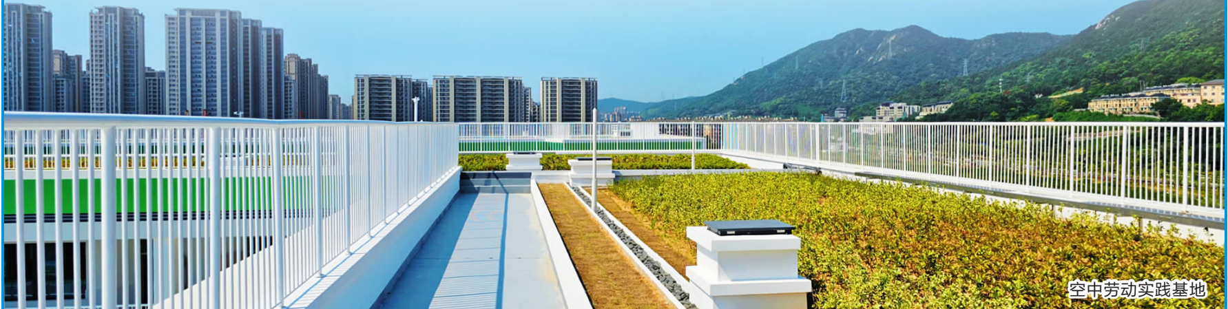
空中劳动实践基地