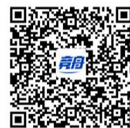
(内容来源竞舟客户端)

在纪念馆的楼上是三忠祠，为祭奠葛云飞、王锡朋、郑国鸿三位总兵而建造的祠堂，建筑面积626平方米。