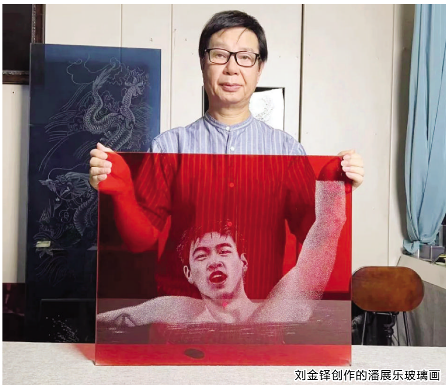
刘金铎创作的潘展乐玻璃画

在巴黎奥运会上，中国游泳运动员潘展乐绝对是“炸裂”的存在，拿下男子100米自由泳金牌后，在男子4×100米混合泳接力中再次刷新成绩，最后一棒游出45秒92的成绩，中国队最终夺得这一宝贵的金牌，打破了美国队在该项目长达40年的垄断。