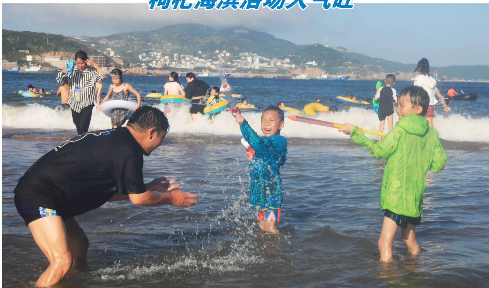
盛夏时节,海风轻拂。近日,在嵊泗县枸杞岛大王沙滩,许多市民和游客带着孩子在海边游泳、戏水,感受海岛生活的悠闲与自在。