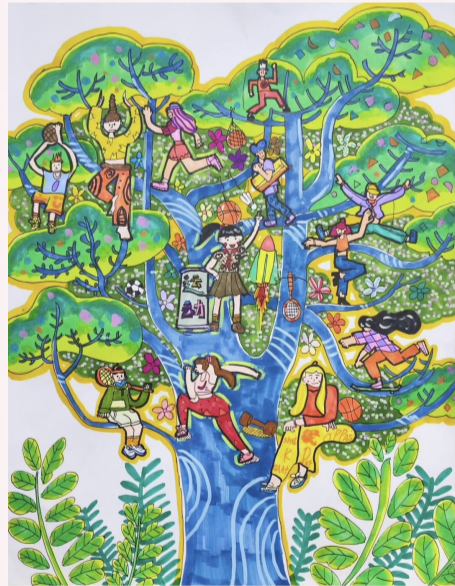
生命在于运动 小记者 陈艺欣(证号E07148)