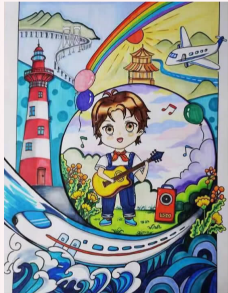
歌颂美好生活 小记者 沈航墨(证号E07130)